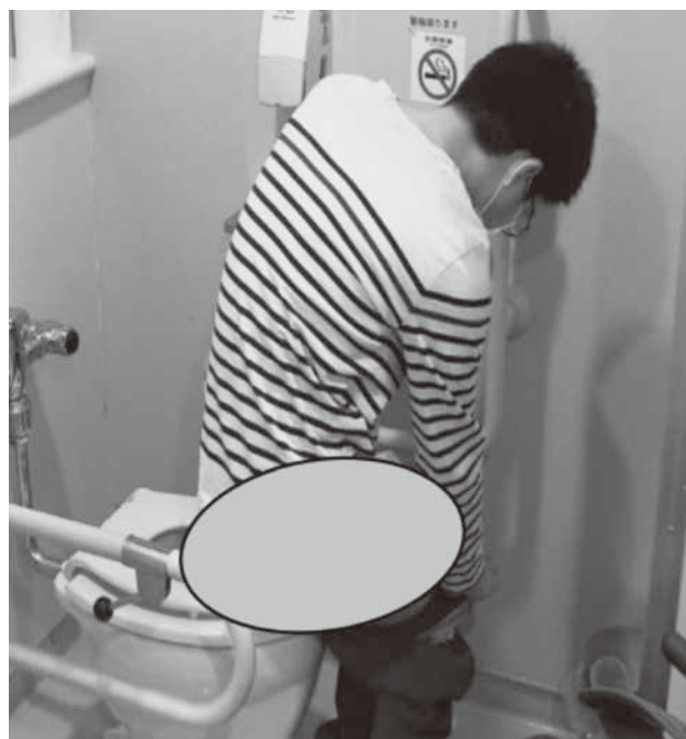
図1 トイレでの排尿練習

週2～3回の頻度でOT実施。入所当初は車いすを止める位置が分からず、手すりに近付きすぎて立ち上がり時にバランスを崩していた。また、ズボンの着衣では立位が不安定なため、引き上げたズボンが何度もずり落ち、すぐに「手伝って」と言って介助を求めていた。覚えた動作も自信がないのか「これでいい？」と執拗に確認する様子が見られた。そこで手足の位置やズボンをどこまで引き上げるかなど1つ1つの動作を細かく伝え、できたことを称賛し、時間がかかっても最後まで取り組むよう促した。また、手すりも横型のタイプでは上肢での支持が弱く、体を起こしておくだけで精一杯となり、ズボン着脱が難しかったため、上肢の屈曲パターンを利用できる縦型の手すりでの練習した。その結果、車いすからの立ち上がりや立位保持が安定することでズボンの着脱や便座への移乗が可能となり、依存的な発言や動作確認も見られなくなった。そして、その後、病棟スタッ