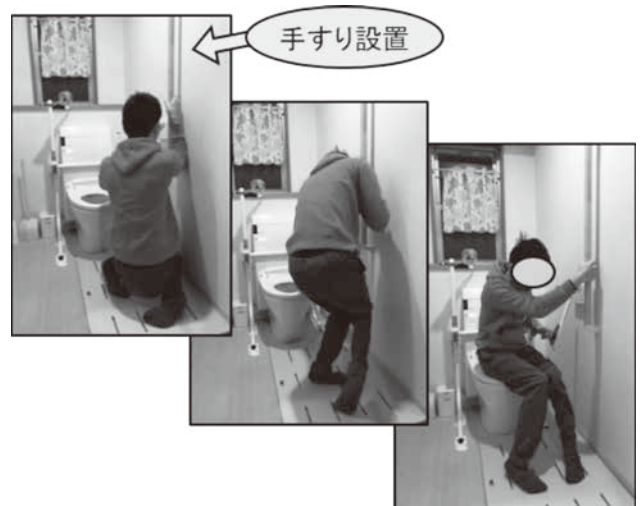
図3 家庭での排便動作

2回の入所を含む約2年間のOT支援を通して家庭での排泄動作が可能となった。1回目の入所で排尿動作を獲得したが、外来OTで進めた家庭でのしびん排尿では母と子の依存と過介助の関係が強く、自立には至らなかった。しかし、2回目の入所での排便動作獲得を機に家庭のトイレでの排尿と排便の自立が可能となった。